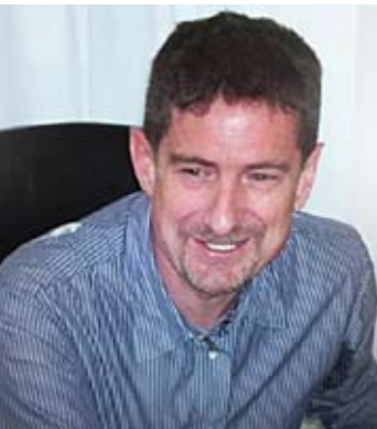
Il Sindaco Claudio Battazza