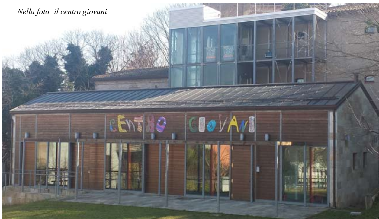
Nella foto: il centro giovani

rete e dei laboratori - mettere a disposizione spazi e strutture attrezzate. Gli spazi individuati per tutte le atti-