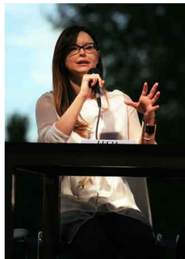
Avv. Lucia Annibali

che ha rappresentato un tema di grande attualità dell'estate appena conclusasi: "La tranquillità nella quale si è svolto l'evento - dichiara - è la dimostrazione del fatto che le politiche di pura repressione sono sbagliate. La collaborazione tra chi organizza eventi, l'amministrazione comunale e le forze dell'ordine (un ringraziamento lo rivolgo a tutti, al Prefetto in particolare) si è rivelata fondamentale. Ciò che in riviera è accaduto nella scorsa estate ci deve far riflettere ma anche far capire che non è vietando ai nostri ragazzi