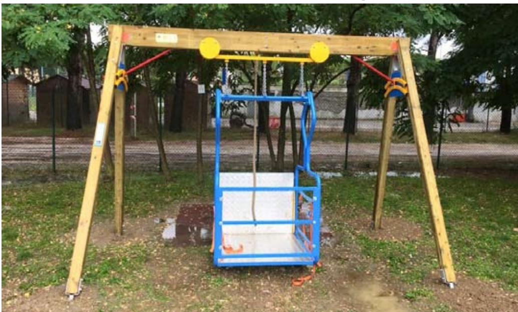
Altalena per disabili nel Parco del Conca

La cifra ammonta ad € 2.640,00 ed è stata donata in forma di buoni pasto per i bambini delle scuole materne appartenenti alle famiglie più in difficoltà; con tale somma sarà possibile fornire ad essi 480 buoni.