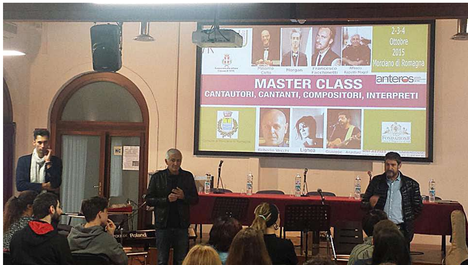
Momento della Master Class

coristi di conoscere la realtà della Valconca anche dal punto di vista dell'ospitalità e dell'enogastronomia, per andarsene, e magari tornare, con un bel ricordo".