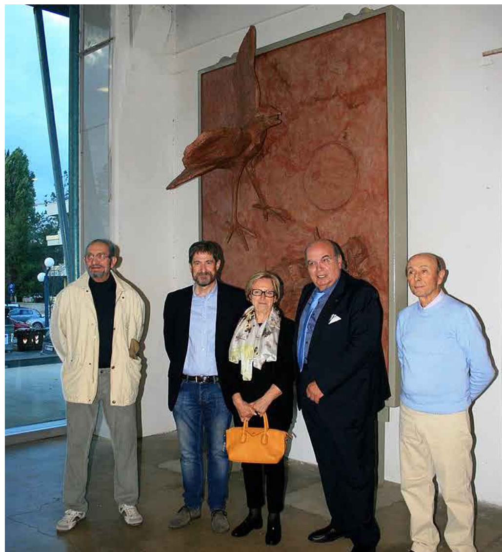
Momento dell'inaugurazione della scultura di Guerrino Bardeggia

be costituita da olio minerale sintetico derivante da prodotti petroliferi. L'olio alimentare inoltre viene usato come base di partenza per la creazione di bio-diesel o gasolio ecologico, quindi il prodotto viene notevolmente 'nobilitato' passando da rifiuto a combustibile ecologico. Anche le bottiglie di plastica utilizzate per conferire l'olio sono avviate al recupero nella filiera della plastica.